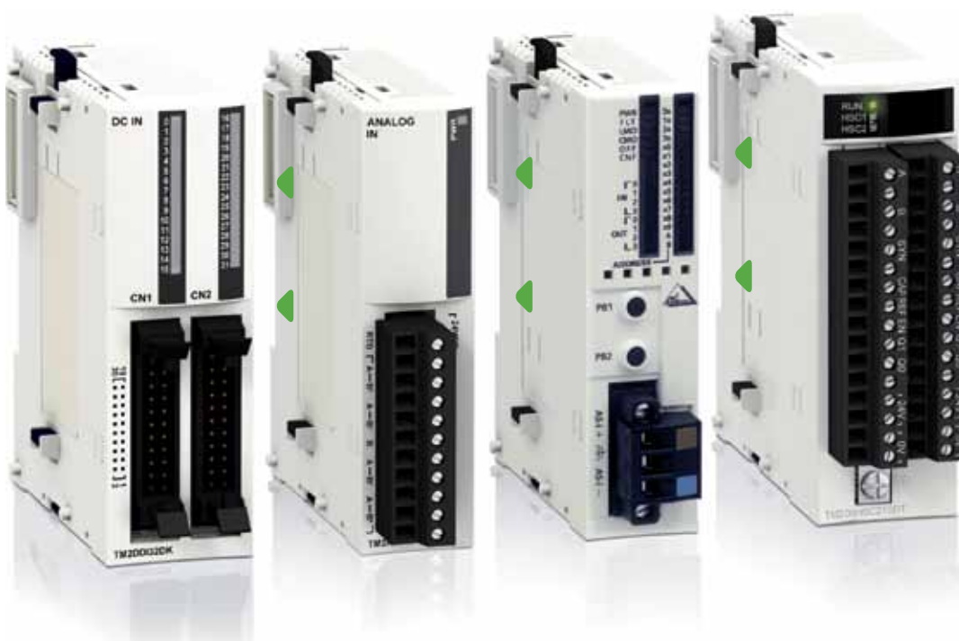
Модули расширения входов-выходов быстродействующего счётчика